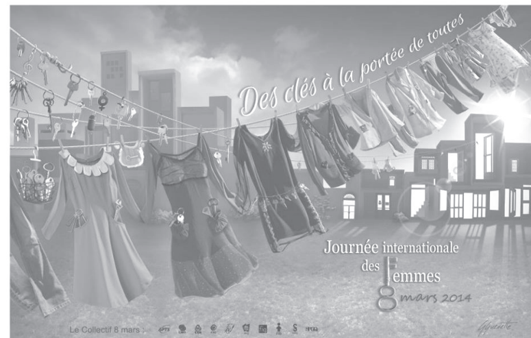
Illustration: Geneviève Guénette

En 2014, l'ONU a placé la Journée internationale des femmes sous le thème du progrès et de l'égalité avec le slogan suivant : « L'égalité pour les femmes, c'est le progrès pour toutes et tous ». Selon l'ONU, « la Journée internationale des femmes fournit [...] l'occasion de dresser un bilan des progrès réalisés, d'appeler à des changements et de célébrer les actes de courage et de détermination accomplis par des femmes ordinaires, qui ont joué un rôle extraordinaire dans l'histoire de leurs pays et de leurs communautés ».