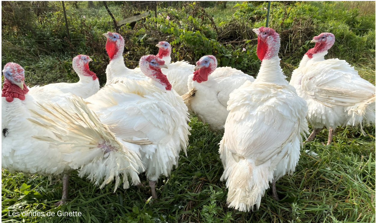
Les dindes de Ginette